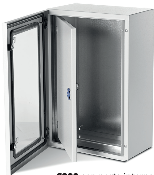
S200 con porta interna