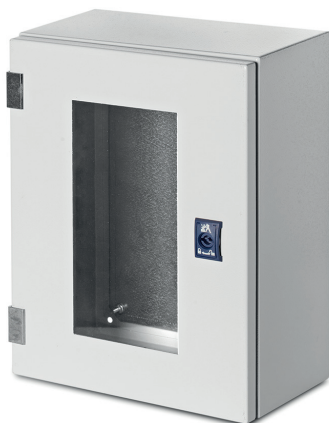
TABELLA DIMENSIONI S200