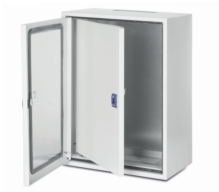
S100 con porta interna